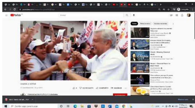
Figura 5. Captura spot “Vamos a votar”