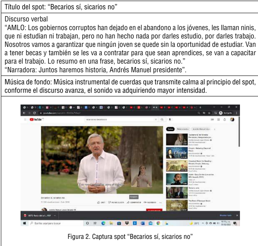
Figura 2. Captura spot “Becarios sí, sicarios no”