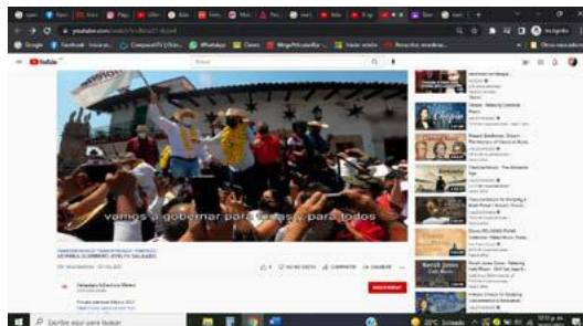
Figura 8. Captura spot “Morena Guerrero – Evelyn Salgado “