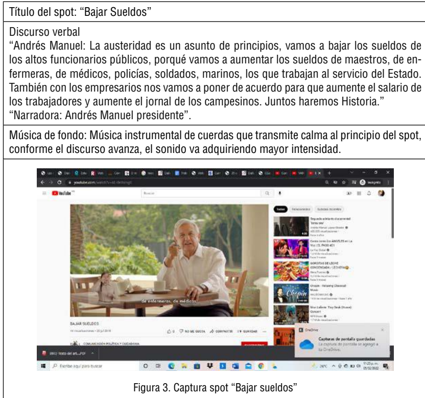
Figura 3. Captura spot “Bajar sueldos”

solución del problema al mencionar las estrategias que utilizará para resolverlo, que en la problemática planteada sería bajar los sueldos de los funcionarios y aplicar la austeridad en todos los niveles de gobierno.