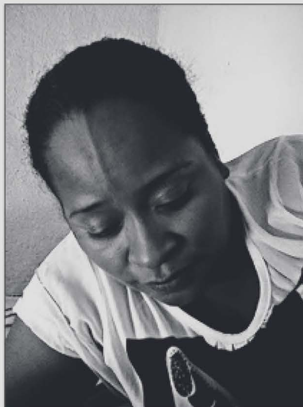
Fuente: Añorve, 2013. Fotografía: Gozo María [Marijose] Hernández Fuentes.

Ambas mujeres son originarias de la Costa Chica, Leonila de Oaxaca, y Gozo María de Guerrero. Son casos ocurridos con 10 años de diferencia. El primero fue mediáticamente más visible; el segundo no. El caso de Leonila fue bandera de reclamos de mujeres organizadas de Guerrero (ALCOCER, 2020) y movilizó a mujeres servidoras públicas a nivel local, en Acapulco y a nivel estatal, a su vez se movilizó discursivamente a mujeres organizadas Red de Mujeres Empleadas del Hogar (EL SUR, 2017), lo que posibilitó el reclamo de justicia en el estado, aunque no se significó investigación adecuada o reparación del daño.