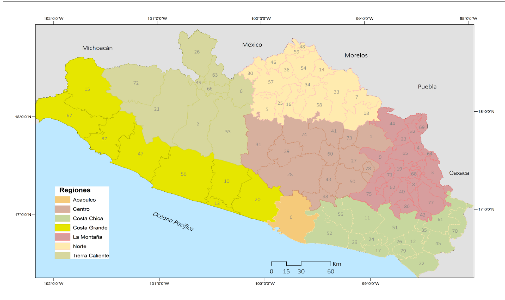
Figura 1. Guerrero: división político-administrativa